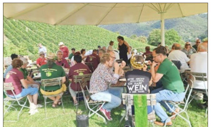
Deutsches Eck, Koblenz, Weinpicknick Thüringer Weinbauverein Bad Sulza e.V

mit großer Freude und Hoffnung haben wir unsere Vereinsfahrt 2023 nach Koblenz an den Mittelrhein erwartet. Vom 15. bis 17.09.2023 sollte es nun für 53 Mitglieder des Thüringer Weinbauvereins Bad Sulza e.V. mit dem Bus auf Vereinsfahrt gehen. Wir starteten mit der Firma City-Tours aus Zeit gutgelaunt Richtung Rhein. Unser sensationelles Frühstücksbuffet, das wir immer in Eigenregie organisieren und auf einem großen Parkplatz aufbauen, ließ wirklich keine Wünsche offen. Bei bestem Reise-wetter konnten wir die wunderschöne Weinlandschaft am Rhein in vollen Zügen genießen und die idyllischen Orte wie Leutesdorf, Bacharach oder St. Goar bei verschiedenen Stadtführungen und Weinfesten erkunden.