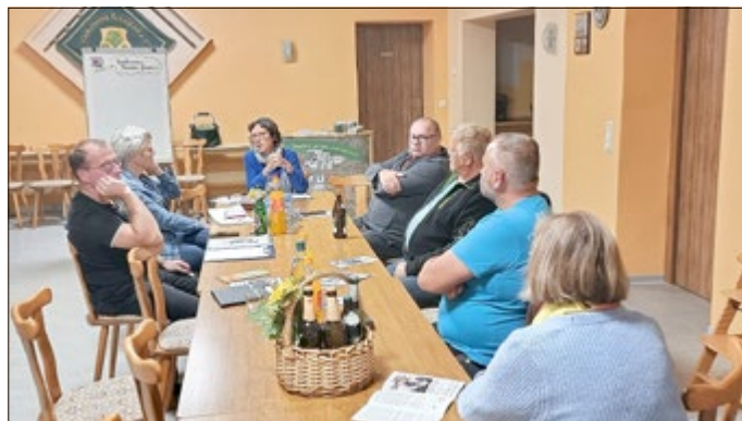
Ehrenamtsstammtisch in Eckolstädt

Die Diskussion dazu war so intensiv und angeregt, dass sich der ELBS entschlossen hat, sein Vernetzungstreffen am 21. November 2023 genau dieses Themas zu widmen. Die Einladung dazu wird die nächsten Tage noch an alle genau mit Tagesordnung etc. pp. gesendet.