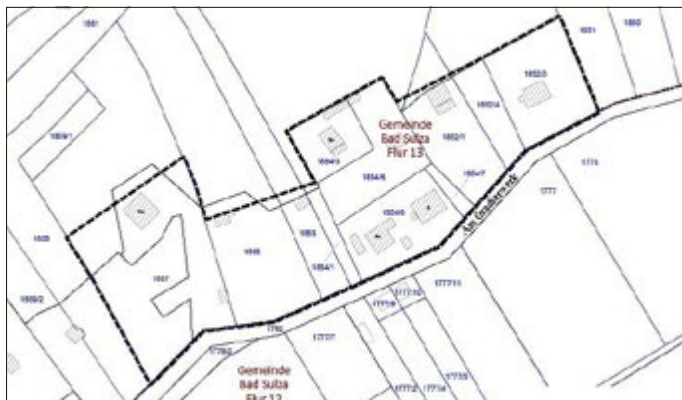
Auszug aus dem Amtlichen Liegenschaftskataster - unmaßstäblich

Amt für Landwirtschaft, Flurneuordnung und Forsten Süd Außenstelle Halle Mühlweg 19, 06114 Halle/S.