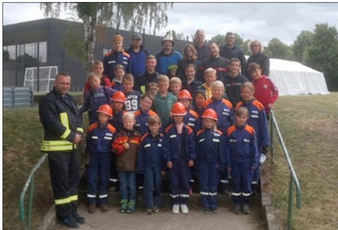
Gruppenfoto Jugendfeuerwehr Auerstedt/Reisdorf und Bad Sulza

Kurz vor den Sommerferien, nach 2 Jahren Zwangspause, ging es für die Jugendfeuerwehr Auerstedt/Reisdorf gemeinsam mit der Jugendfeuerwehr Bad Sulza endlich wieder einmal ins Kreiszeltlager, dieses Mal im Stadion in Apolda.