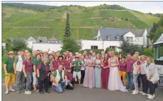
(Weinfest Graach, Thüringer Weinbauverein Bad Sulza e.V. mit 4 Weinhoheiten von der Mosel)

sehr lange geplant, mehrfach aufgeschoben und mit großer Freude und Hoffnung erwartet – unsere Vereinsfahrt 2021 nach Cochem an die Mosel. Nach einer Coronabedingten Pause im Jahr 2020 sollte es nun endlich für 52 Mitglieder des Thüringer Weinbauvereins Bad Sulza e.V. vom 17. bis 19.09.2021 mit dem Bus auf Vereinsfahrt gehen. Nach befolgter 3G-Regel starteten wir mit der Firma Bustouristik Höhne aus Schkölen gutgelaunt Richtung Mosel. Bei bestem Reisewetter konnten wir die wunderschöne Weinlandschaft an der Mosel während einer Schifffahrt in vollen Zügen genießen und die idyllischen Orte wie Beilstein, Bernkastel-Kues oder Cochem bei verschiedenen Stadtführungen erkunden.