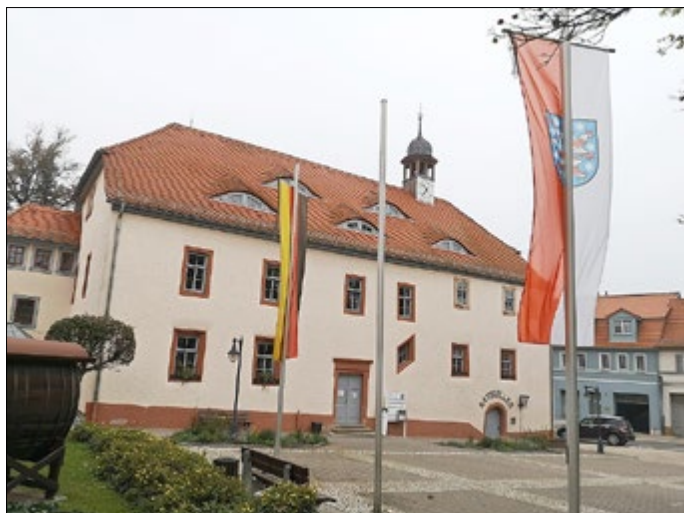
Dirk Schütze Bürgermeister

Eineinhalb Monate nach der Hochwasserkatastrophe in NRW und Rheinland-Pfalz wurde am Samstag, dem 28.08.2021 an die Opfer der Flutkatastrophe gedacht. Auch die Stadtverwaltung Bad Sulza beteiligte sich mit gehissten Flaggen an dem bundesweiten Gedenktag.