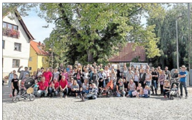
Kirmesständchen 2019

(Text: R. Ritter um 1900 Melodie: O. Liebeskind um 1860)