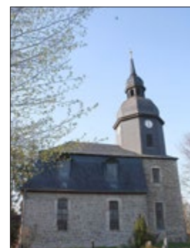
Kirche zu Pfuhsborn

Dieses Jahr sind einige kleine Ausbesserungsarbeiten im Ort geplant, angefangen wird im Mai mit dem Zugang zum Friedhof bzw. Fußweg zur Kirche.