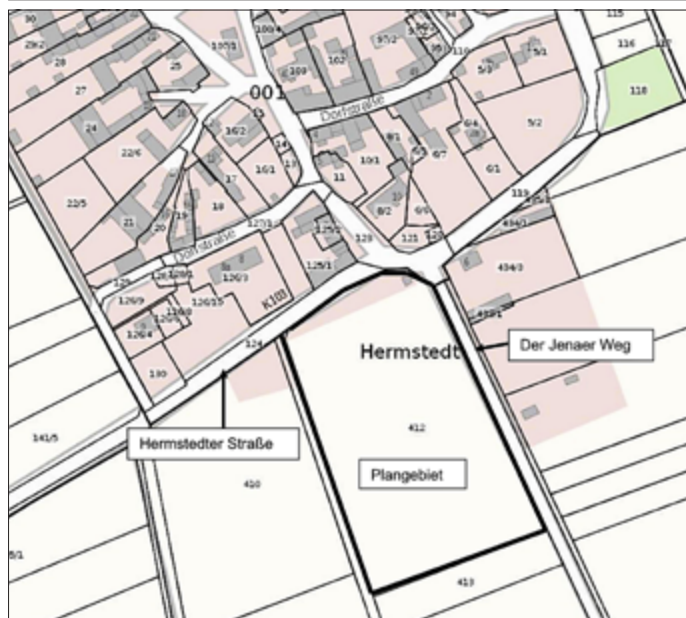
Ausschnitt geoproxy.thueringen.de (entnommen: 03.03.2021) - unmaßstäblich