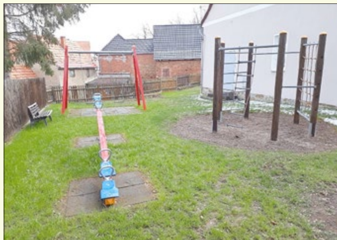
Spielplatz mit neuer Wippe und Doppelschaukel